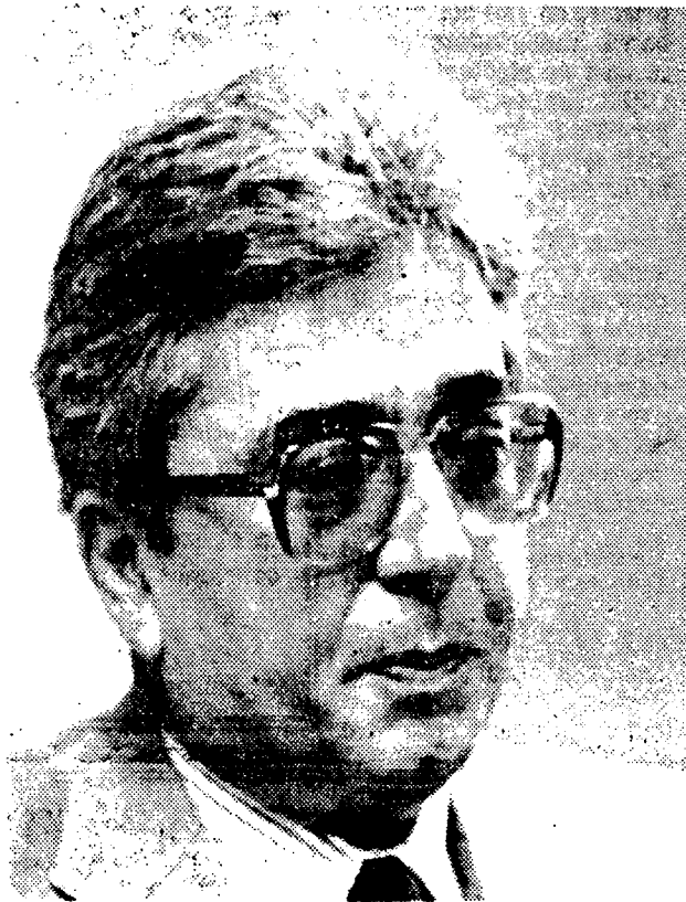
El Director del Green... Venezuela juega un papel importante

Según su opinión, es mejor intentar arreglar el problema a nivel internacional entre miembros de Opep, no-Opep y países importadores, en lugar de que sea en el aspecto interno de la